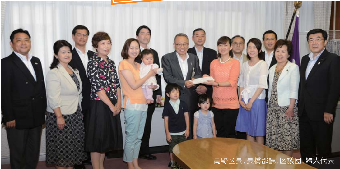
高野区長、長橋都議、区議団、婦人代表

本年5月、日本創成会議が、2040年までに20～39歳の女性人口が50%以上減少するという「消滅可能性都市」となる自治体を発表しました。東京23区では唯一、豊島区がその中に含まれました。